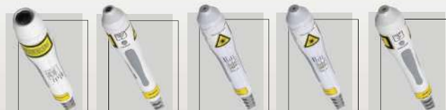
Probe 1 Led RGB Probe 2 Led 850 nm Probe 3 Laser 660 nm Probe 4 Laser 808 nm Probe 5 Laser 904 nm