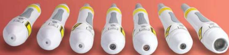
Probe Laser 808 nm Probe Laser 660 nm Probe Laser 904 nm Probe Led 410 nm Probe Led 590 nm Probe Led 850 nm Probe Led RGB