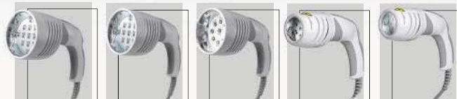
Cluster G1 Led 590 nm, 630 nm e 850 nm Cluster G2 Led 590 nm e 850 nm Cluster G3 Led RGB, Led 590 nm e Led 850 nm Cluster P1 Led RGB e Laser 808 nm Cluster P2 Led 630 nm e 850 nm